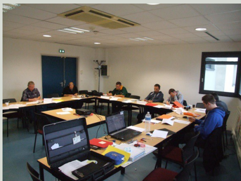
Les candidats JA1 en grande concentration